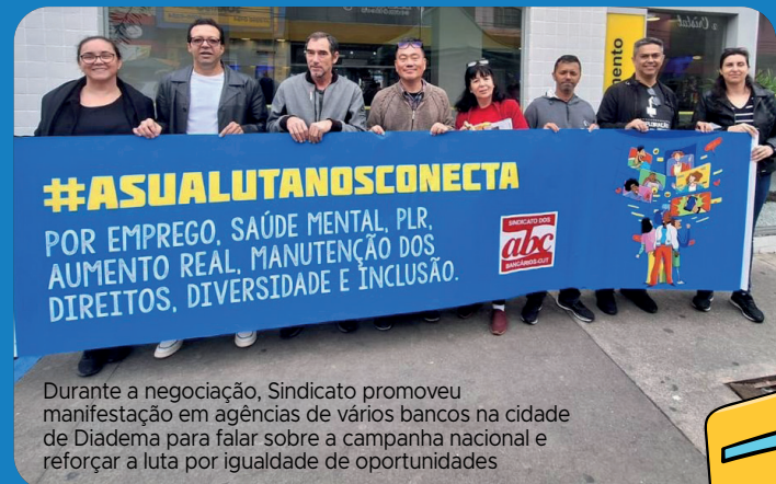
Durante a negociação, Sindicato promoveu manifestação em agências de vários bancos na cidade de Diadema para falar sobre a campanha nacional e reforçar a luta por igualdade de oportunidades

A resposta dos bancos: Os representantes dos bancos