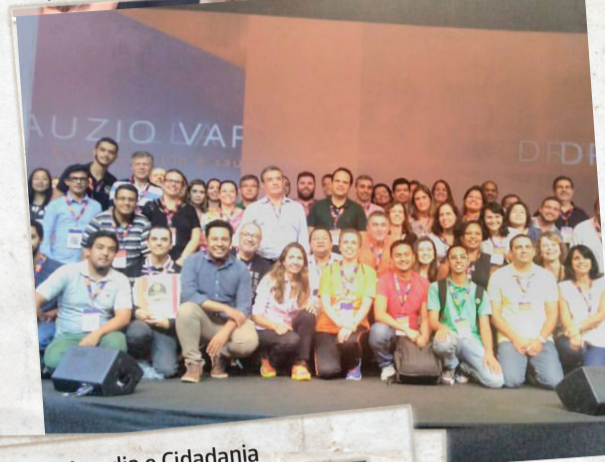
Parceria com a Ong Moradia e Cidadania