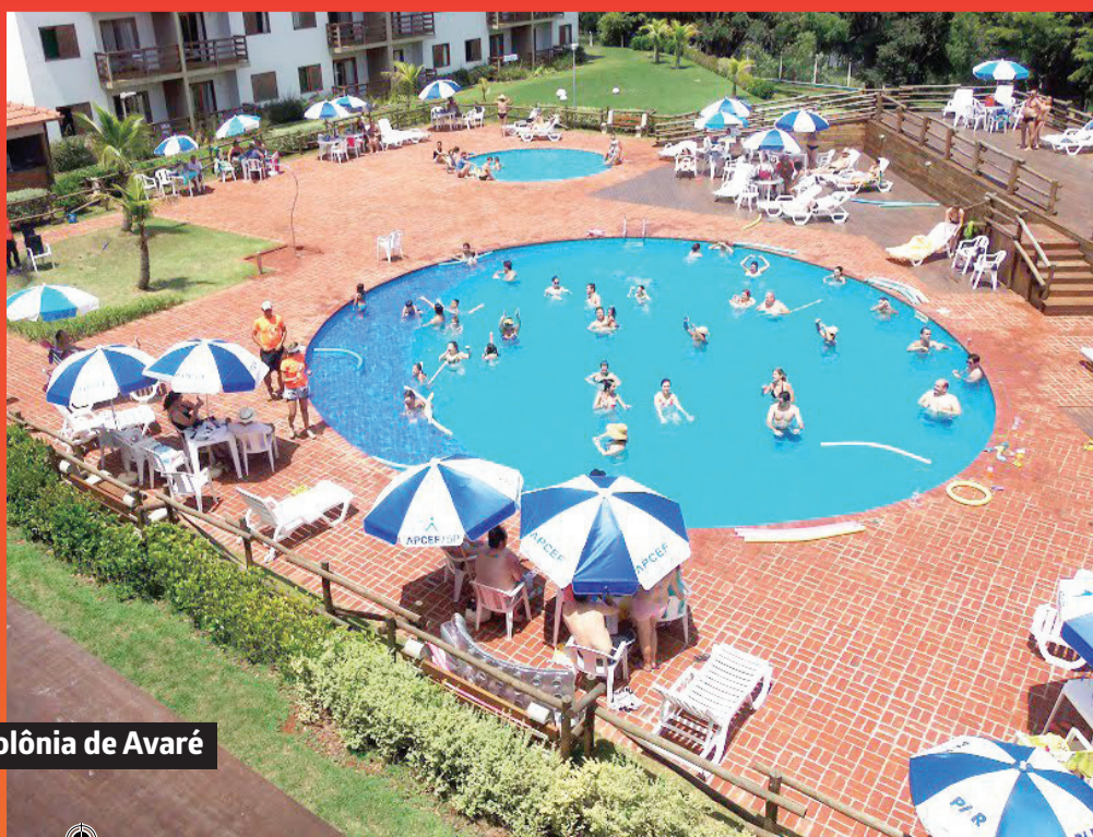
Colônia de Avaré

- Inaugurou novo ginásio de esportes na subsede de Bauru