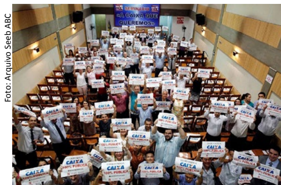
Assim como ocorreu no início deste ano, com a campanha vitoriosa pela Caixa 100% pública, agora é hora de intensificar a luta por mais contratações

No site www.fenae.org.br/maisempregadosja serão disponibilizadas as artes do Dia Nacional de Luta por Contratação Urgente