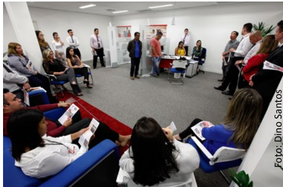
Diretores do Sindicato em reunião com funcionários do banco, durante atividade da campanha de valorização

Nas agências de Santo André os diretores sindicais conversaram com os funcionários e distribuíram o Jornal do Cliente, produzido pelo Sindicato e que detalha as condições de trabalho, a campanha em curso e o direito dos usuários e clientes de banco. A campanha de valorização utiliza as propagandas