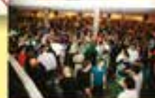
Festa dos Bancários