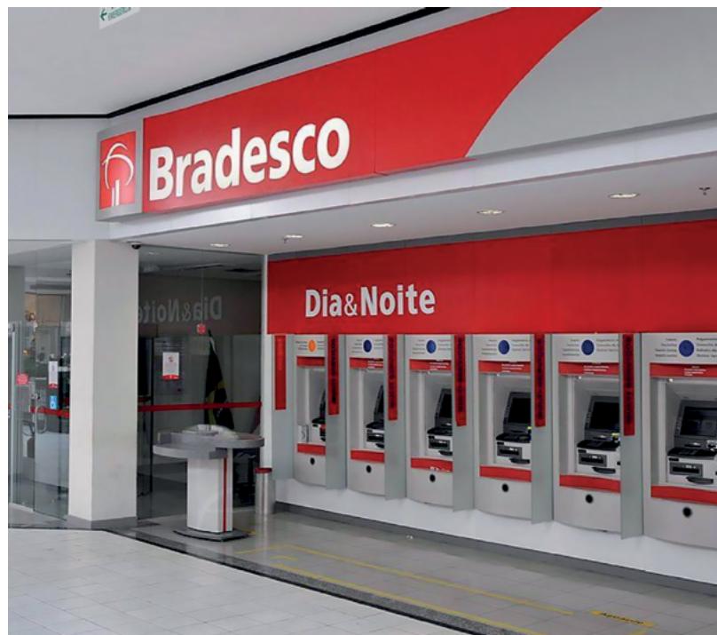
Bradesco registrou lucro líquido de R$ 6,515 bilhões, mas anunciou que pretende fechar 450 agências em 2021