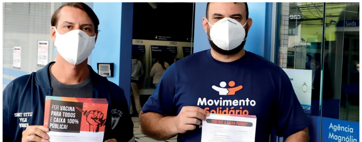
Apesar do papel fundamental no combate à pandemia, Caixa é sempre ameaçada por privatizações