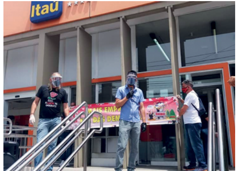
Bancários se mobilizam presencialmente e nas redes sociais contra as demissões

Demissões - As receitas com prestação de serviços e tarifas destes bancos totalizaram R$ 100,4 bilhões no período. Estas receitas secundárias, irrisórias frente ao que os bancos arrecadam com as demais transações, cobriram, com folga (exceto a Caixa), as despesas de pessoal, incluindo-se o pagamento da PLR. Os cinco bancos juntos fecharam 9.499 postos de trabalho em doze meses. O saldo foi positivo somente no Itaú, com 736 novos postos abertos em relação a setembro de 2019, contudo, com saldo negativo em relação ao trimestre anterior (71 postos fechados).