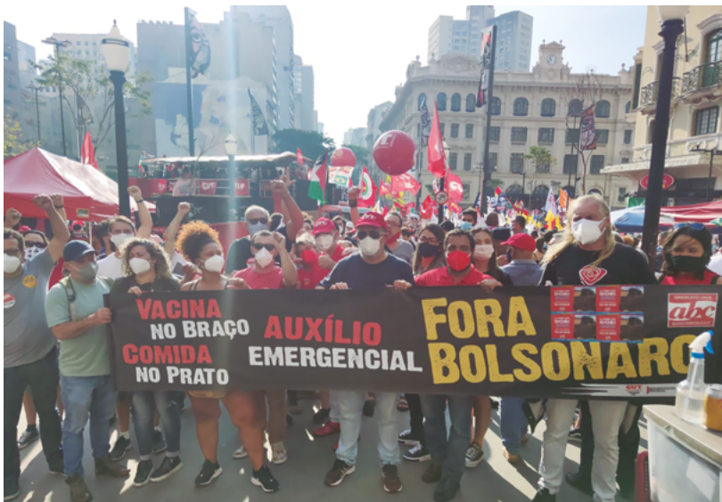
Sindicato esteve nos protestos do último dia 28 de agosto